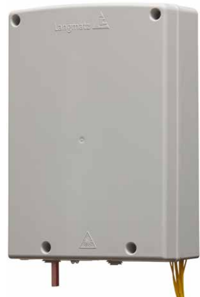
▲ Gf-AP L 3.0 geschlossen