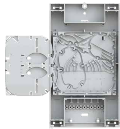
▲ Gf-AP M+ 3.0 Innenansicht mit geöffneter Langmatz Kassette