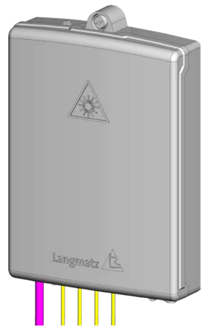
▲ Gf-AP Gr. M geschlossen