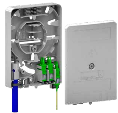
▲ Gf-AP Gr. S Innenansicht