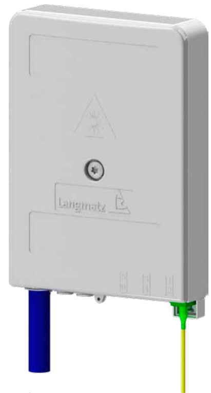
▲ Gf-AP Gr. S geschlossen