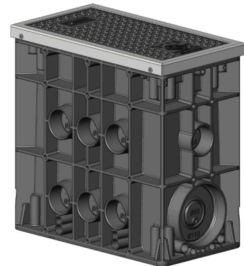
▲ EK437 - Pozzetto piccolo con protezione dei bordi