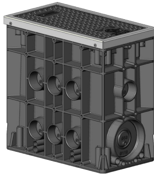
▲ EK437 - Pozzetto piccolo con protezione dei bordi