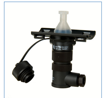
Steckverbinder EK 361