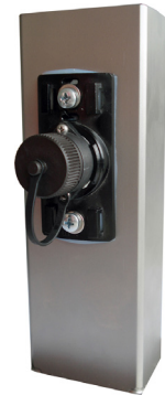
Befestigung am Vierkant-Mast angeschraubt