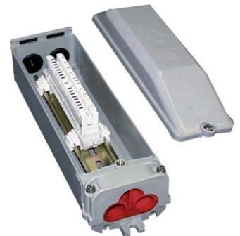
Abb.: Mastendverschluss mit LSA-PLUS-Leiste