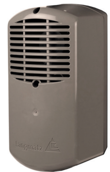
Akustischer Signalgeber crossguide

Der akustische Signalgeber crossguide ist ein Qualitätsprodukt von Langmatz mit Weitblick auf die Bedürfnisse sehbehinderter und blinder Menschen. Er sorgt in Verbindung mit dem Signal-Anforderungsgerät crossguide (EK 533 plus) für die kostensparende Abstrahlung des Orientierungs- und Freigabesignals aus einem Gehäuse. Beide Signaltöne können unabhängig voneinander in der Lautstärke eingestellt werden. Durch zwei getrennte Abstrahlrichtungen können die Signale sowohl in die Fußgängerfurt, als auch um den Mast abgestrahlt werden. Wahlweise ist der Einsatz auch als Einzelsignalgeber möglich. Die neuen Regelungen der DIN 32981 werden erfüllt und sind durch wissenschaftliche Begleitung in der Entwicklung geprüft. Die modulare Bauweise ermöglicht eine Anpassung auf den Einzelfall. Der elektrische Anschluss beschränkt sich auf das Durchverbinden von zwei Aderpaaren. Die damit verbundene hohe Montagefreundlichkeit spart Zeit und damit Kosten.