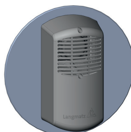
Variante 2: Akustischer Signalgeber zum Einbau in Signalkammer