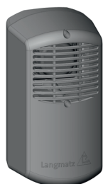
Variante 1: Akustischer Signalgeber Mastmontage