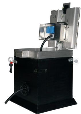
Satelliten-Kleinverteiler EK 602 geöffnet, Kabelauslass geschlossen