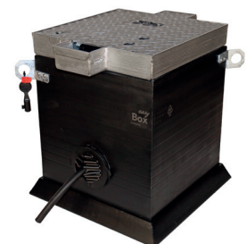
Satelliten-Kleinverteiler EK 602 geschlossen, Kabelauslass geöffnet