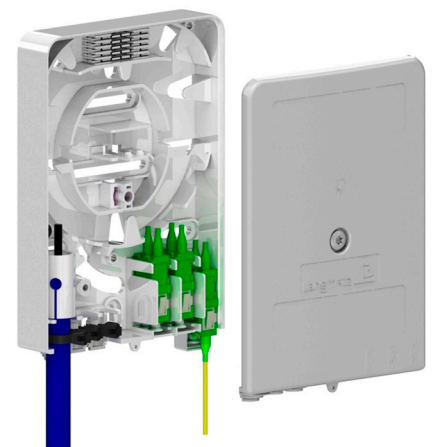
Gf-AP / TA mini Innenansicht