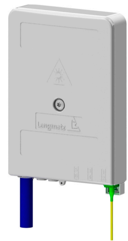
Gf-AP / TA mini

Er ermöglicht ein einfaches Glasfaser-Management in einem robusten, geschützten Gehäuse aus Polycarbonat. Er zeichnet sich aus durch leichtes Handling und einfache Installation bei einem hohen Qualitätsanspruch an die Aufnahme, Verlegung und Inbetriebnahme von filigraner Glasfasertechnik.