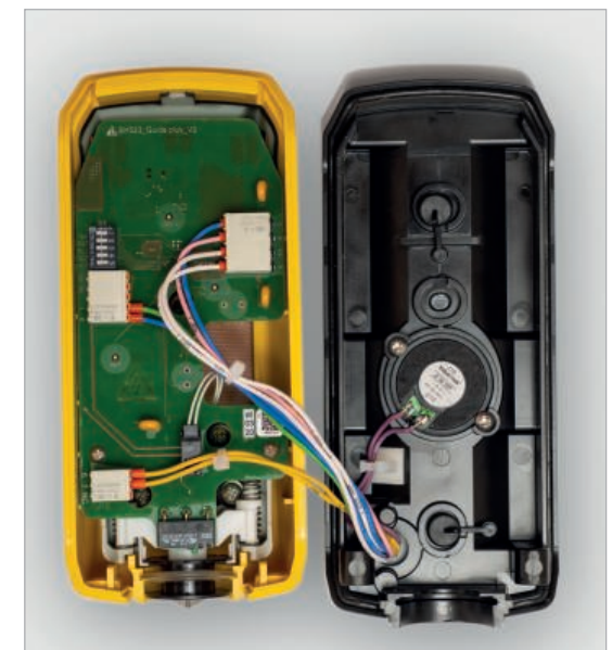
▲ Die Stromversorgung erfolgt aus der Akustik.